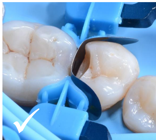
Positionnement correct de la bande matricielle..

Le positionnement correct de la matrice sectorielle LumiContrast est essentiel pour le succès de la restauration des parois proximales ; l'image à gauche montre le positionnement incorrect de la bande matricielle ; pour une restauration optimale du point de contact, la bande matricielle doit dépasser la couronne proximale comme montré sur l'image à droite.