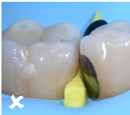
05 Positionnement incorrect de la bande matricielle.