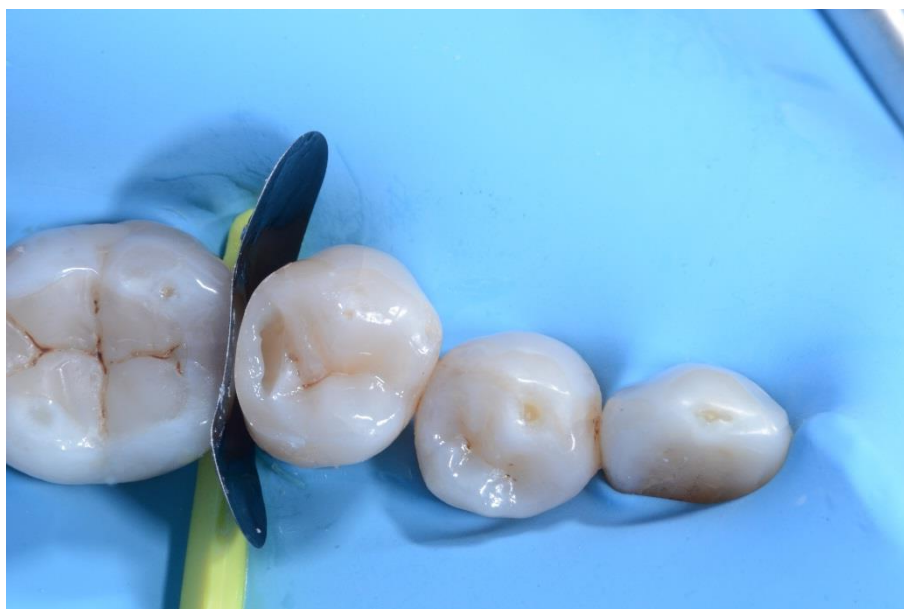
Restauration de la paroi distale interproximale.