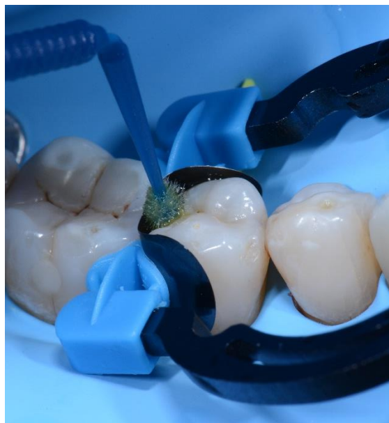
Mordançage de la cavité.