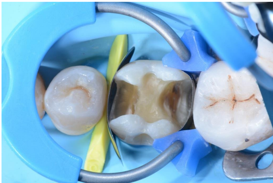
Vista oclusal del primer molar con las matrices seccionales LumiContrast y las cuñas montadas.