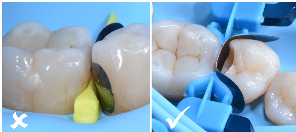
05 Colocación incorrecta de la banda matriz. Colocación correcta de la banda matriz.

Para restaurar satisfactoriamente las paredes proximales es fundamental colocar correctamente la matriz seccional LumiContrast; en la imagen de la izquierda se observa la banda matriz mal colocada. Para conseguir la restauración óptima del punto de contacto, la banda matriz debe ser más alta que la pared proximal de la corona, como se observa en la imagen de la derecha.