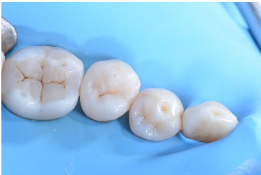
La cavidad oclusal rellena con composite antes del acabado y del pulido.