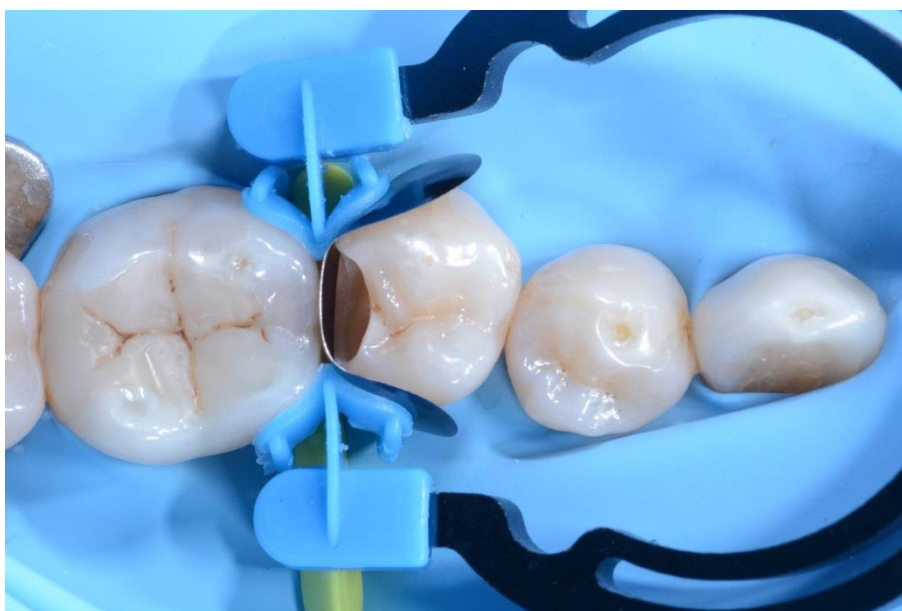
06 La cavidad con myRing Forte, myWedge y la matriz seccional LumiContrast. El anillo myRing Forte rodea con cuidado la banda matriz asegurando una restauración fiel del punto de contacto.

Para restaurar satisfactoriamente las paredes proximales es fundamental colocar correctamente la matriz seccional LumiContrast; en la imagen de la izquierda se observa la banda matriz mal colocada. Para conseguir la restauración óptima del punto de contacto, la banda matriz debe ser más alta que la pared proximal de la corona, como se observa en la imagen de la derecha.