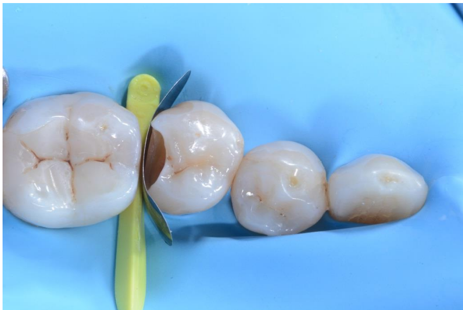
La cavidad después de la preparación, limpieza, remoción de la caries y desinfección.