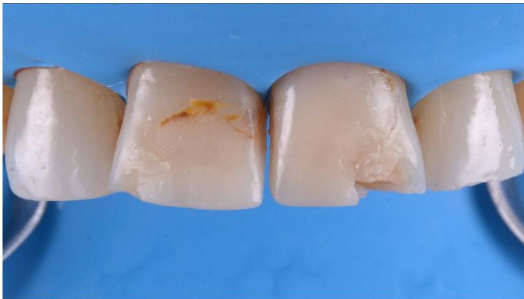
Imagen pre-operatoria de 11 y 21, enseñando las restauraciones de composite que debían ser reemplazadas.