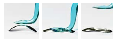
Matrici sezionali in acciaio inossidabile

QuickmatFLEX sono matrici sezionali in titanio ultrasottili (0,03 mm) dotate di un'eccellente memoria elastica. Facili da gestire, offrono il giusto equilibrio di flessibilità e rigidità per ottimizzare il posizionamento e l'adattamento in spazi interprossimali ristretti. Le matrici sezionali, grazie al loro spessore ridotto e alla lega metallica migliorata, resistono alla deformazione essendo caratterizzate da un'elevata resilienza elastica che permette loro di ritornare alla forma originaria. I trattamenti di II classe con le matrici sezionali QuickmatFLEX e i nostri anelli per matrici sezionali consentono di ottenere restauri prevedibili con anatomie corrette, punti di contatto stretti e superfici in composito lisce che richiedono minimi passaggi di rifinitura.