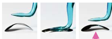
QuickmatFlex matrici sezionali