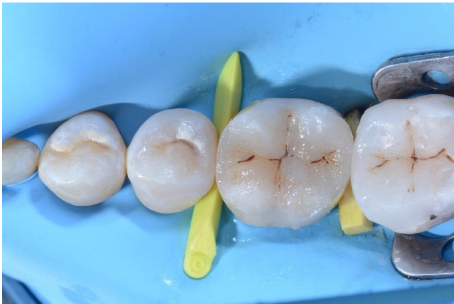
Veduta laterale del # 46 dopo ricostruzione delle pareti interrossimali distale e mesiale.