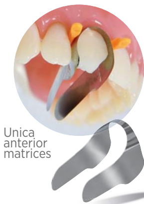
Unica anterior matrices